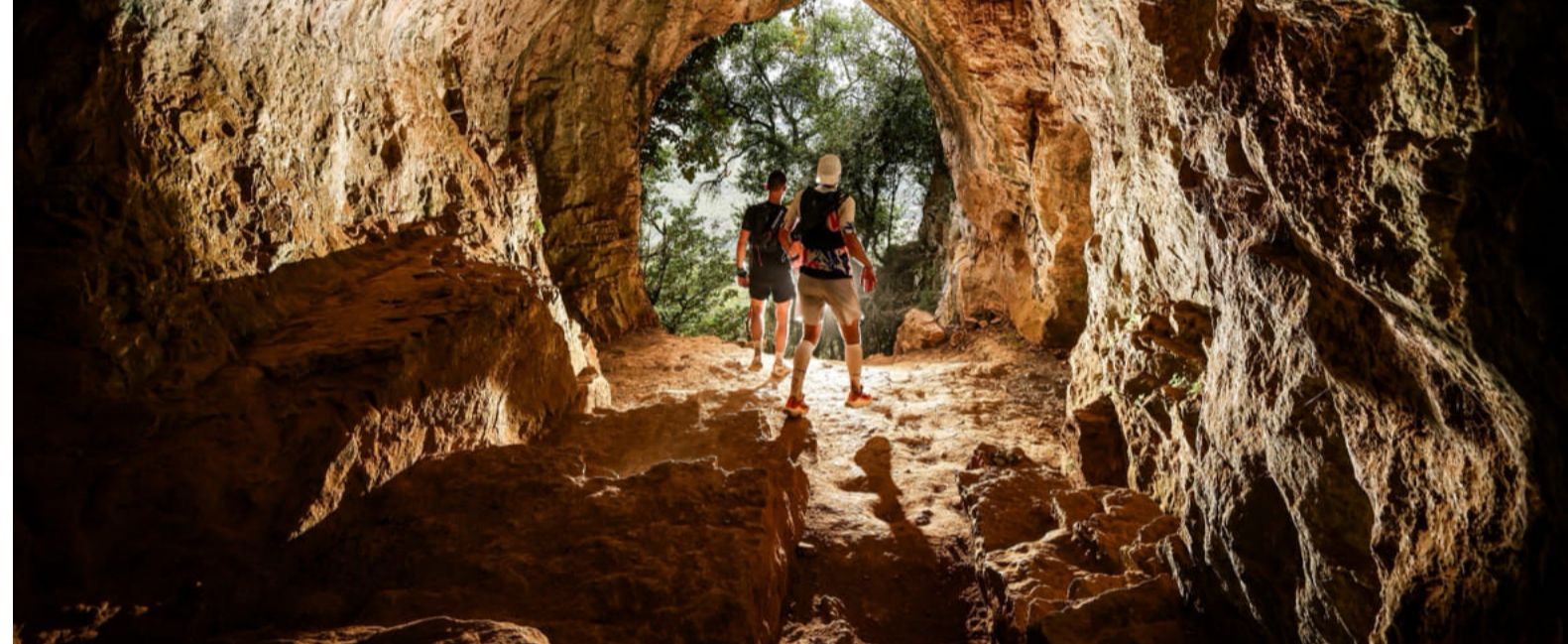
HOKA LES TEMPLIERS 2025